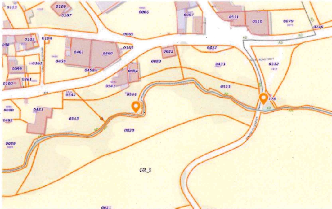
o Localisation du projet par parcelles