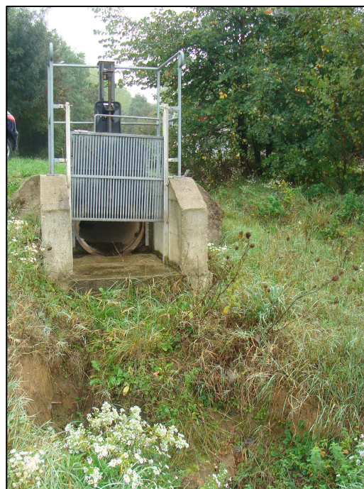
Exutoire du pluvial