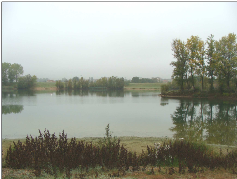
Plan d'eau 966 : Vue d'ensemble