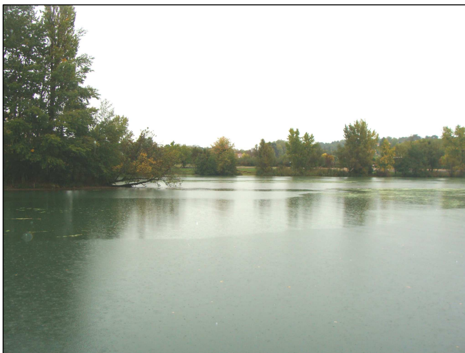
PE 980 : Vue d'ensemble