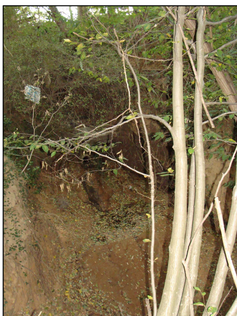
Exutoire aval : fossé (à sec)