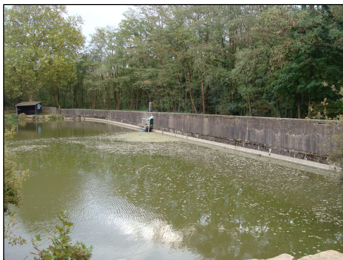
Digue aval du plan d'eau : mur + chaussée