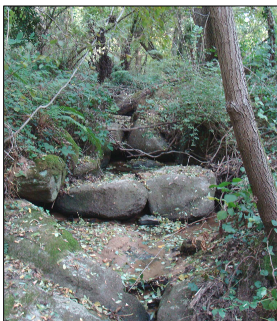
Ruisseau en contre-bas où se déverse le fossé