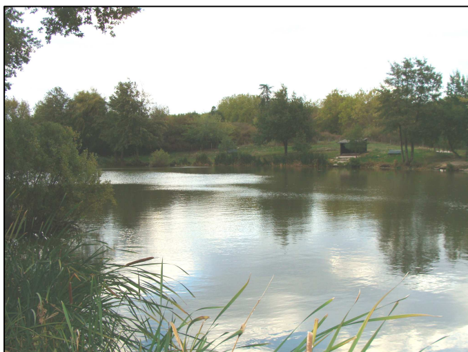
PE 619 : Vue d'ensemble