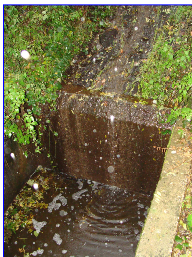
Obstacle de la Maladière amont