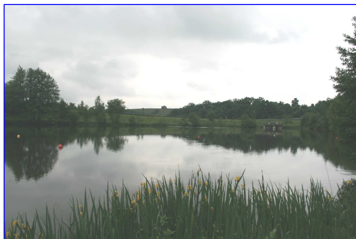
Secteur aval du PE