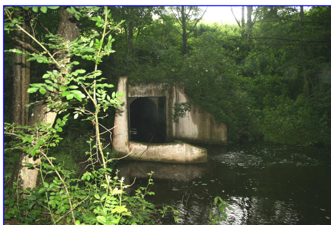
Dispositif de rejet aval, après passage sous la route