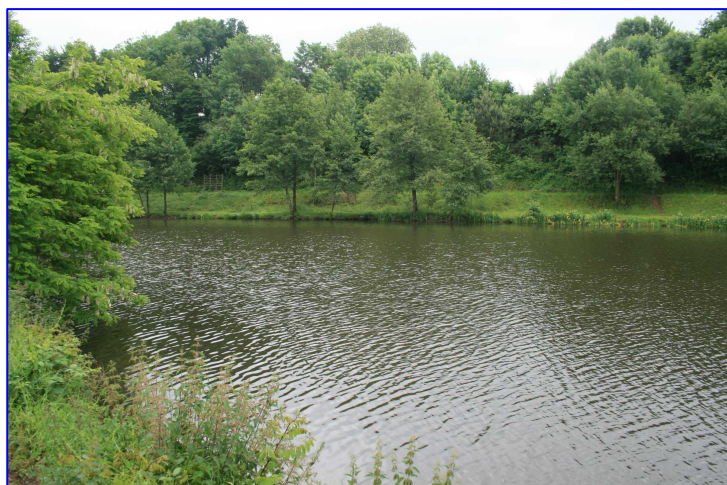
Secteur amont du PE