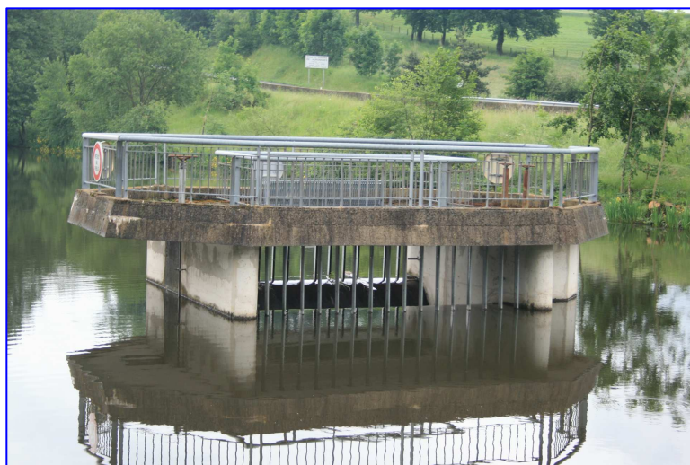
Déversoir principal de crue