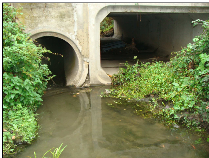
Exutoire : buse + déchargeoir