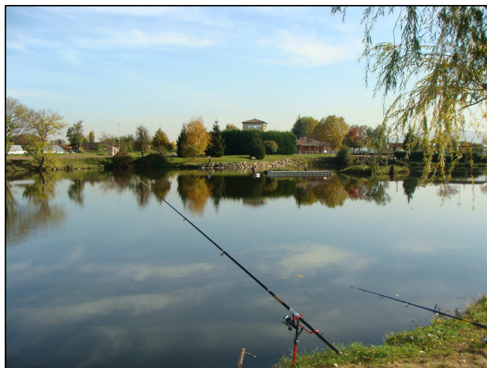
PE 979 : Vues d'ensemble

Arrivée du tributaire : buse + grille non fixée