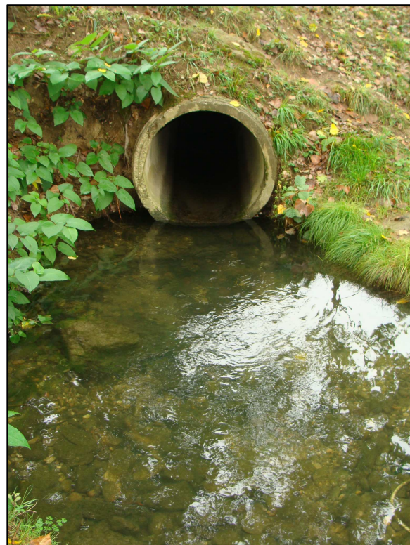
Arrivée du tributaire au niveau du PE