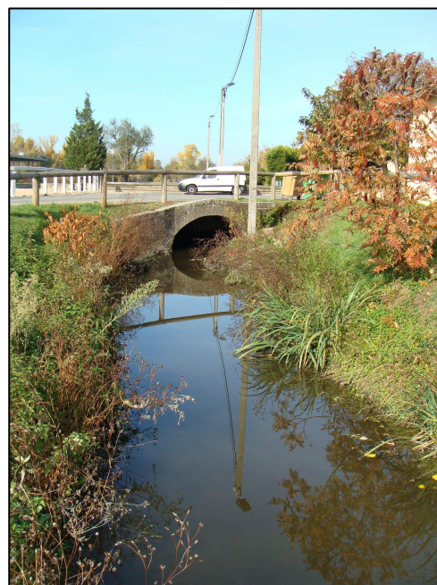
Bief d'Ambérieux juste en amont du plan d'eau