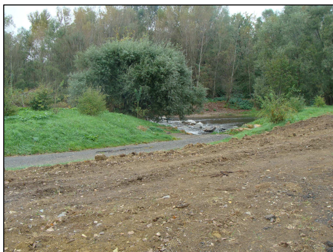
L'Azergues, à côté du PE