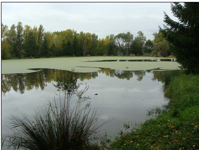
PE 1284 : Vue d'ensemble