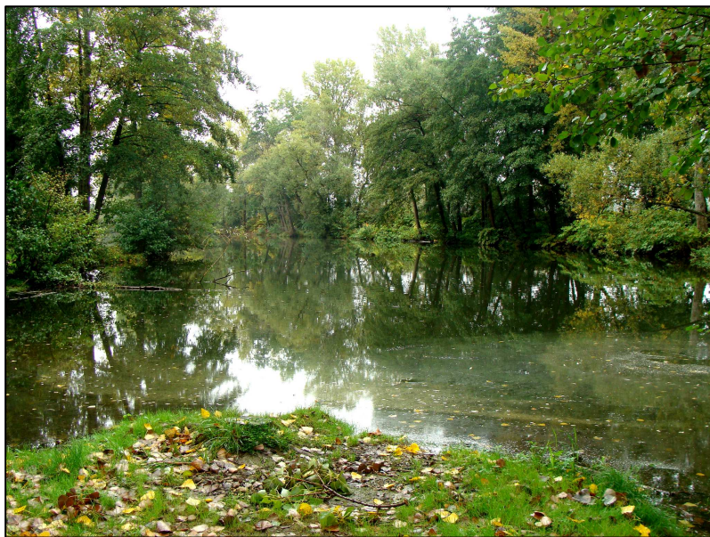
PE 1272 : Vue d'ensemble